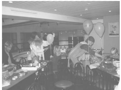
... barnlige lyst