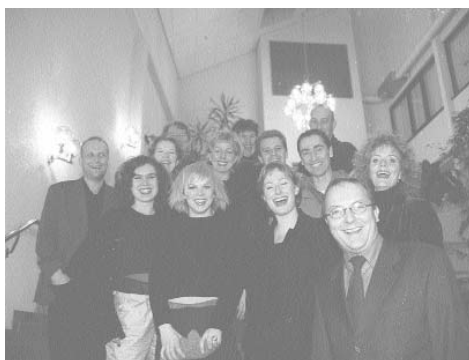
Suppe på spiker

Framsyningar: 16 Den fyrste song hadde urpremiere 31. oktober 1999 og vart spela 28 gongar i 1999.